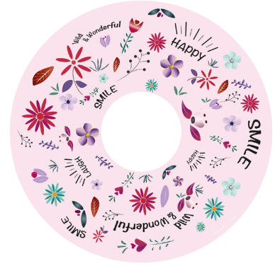
FLOWER POWER PINK