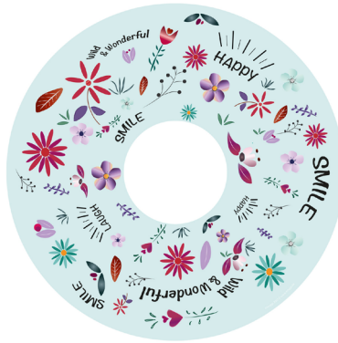
FLOWER POWER TÜRKIS