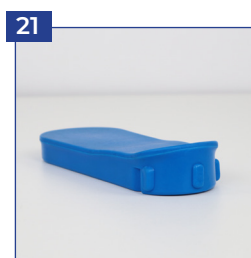
PU-Abdeckung für Toilettenöffnung