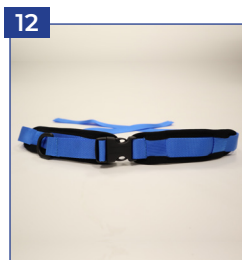
Beckengurt mit Neoprenpolstern