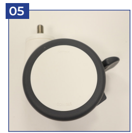
Doppelrollen 100 mm