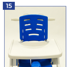
Ventrale Oberkörper Stütze