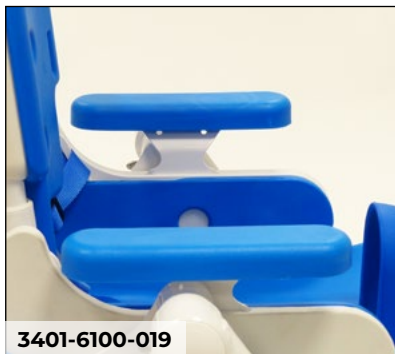
Armlehnen mit PU-Polstern, abnehmbar & höhenverstellbar