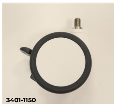
Doppelrollen, 75 mm