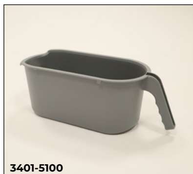
Toiletteneimer, grau mit Halterung