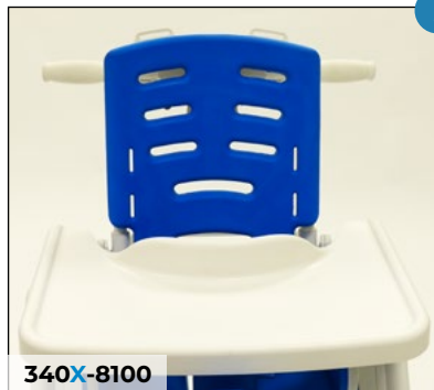
Ventrale Oberkörperstütze abnehmbar, tiefenverstellbar