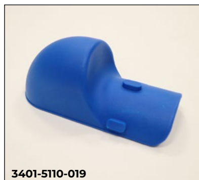
Spritzschutz PU, steckbar