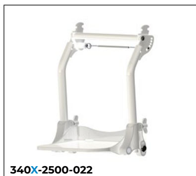
Fußstützanlage winkelverstellbar abnehmbar