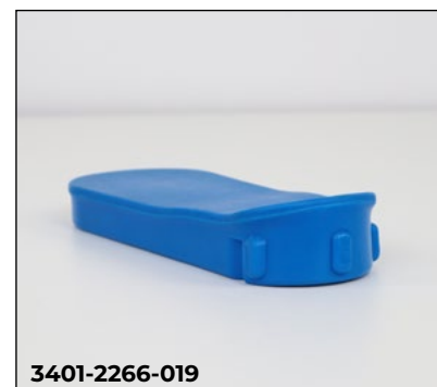
PU-Abdeckung für Toilettenöffnung im Sitzpolster