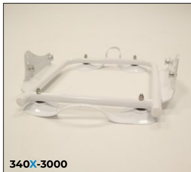
Wannen-Untergestell, Sitzwinkel einstellbar