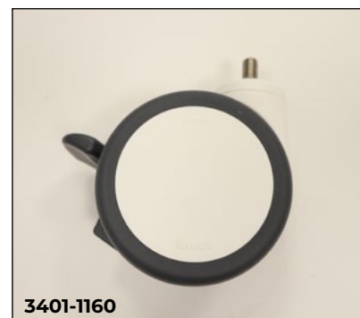
Doppelrollen, 100 mm