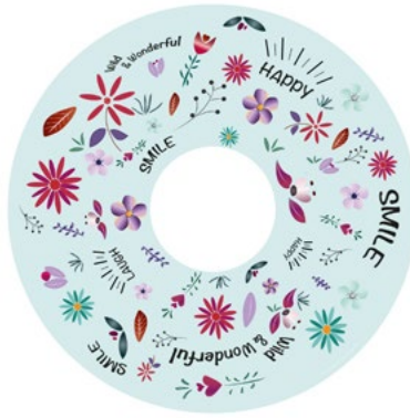
FLOWER POWER TÜRKIS