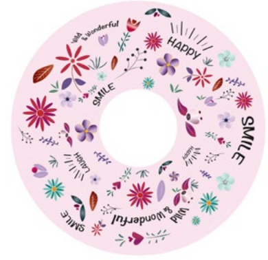
FLOWER POWER PINK