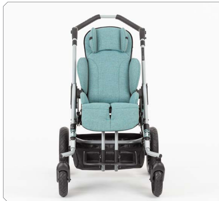
Kompakt. Leicht. Sportlich.