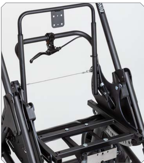
Sitzrahmen und Rückenbasis.