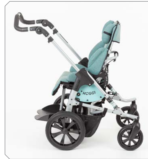
Sitzeinheit gegen Fahrtrichtung.