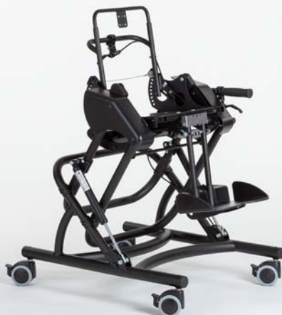
Mit Sitzrahmen & Rückenbasis.