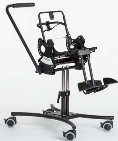
Mit Sitzrahmen & Rückenbasis.