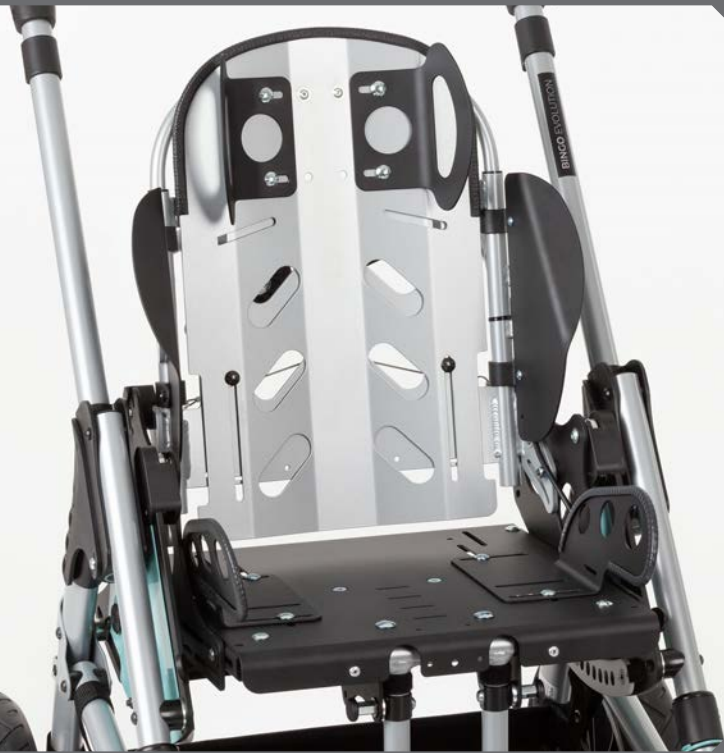
Viele individuelle Einstellmöglichkeiten.

Die multifunktionale Sitzeinheit bietet dir mit einer Vielzahl von verschiedenen Pelotten individuelle Einstellmöglichkeiten für dein Kind.