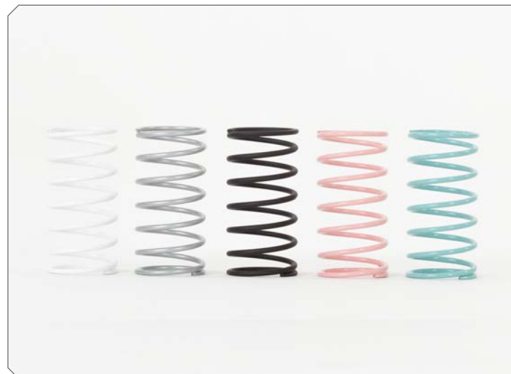
Federsätze in verschiedenen Stärken.