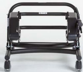
COBRA, unterste Höhenposition.