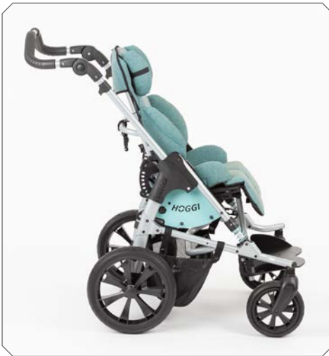
Sitzeinheit in Fahrtrichtung.