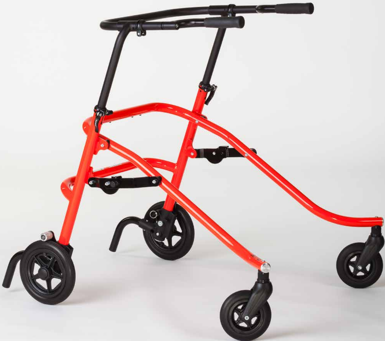
Lauflernhilfe FLUX , Größe 3

Die bewährte Lauflernhilfe im neuen Design.