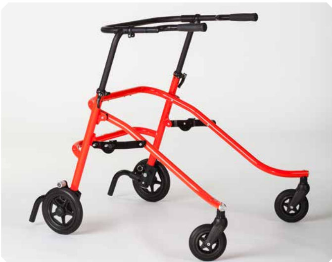
FLUX Größe 3.