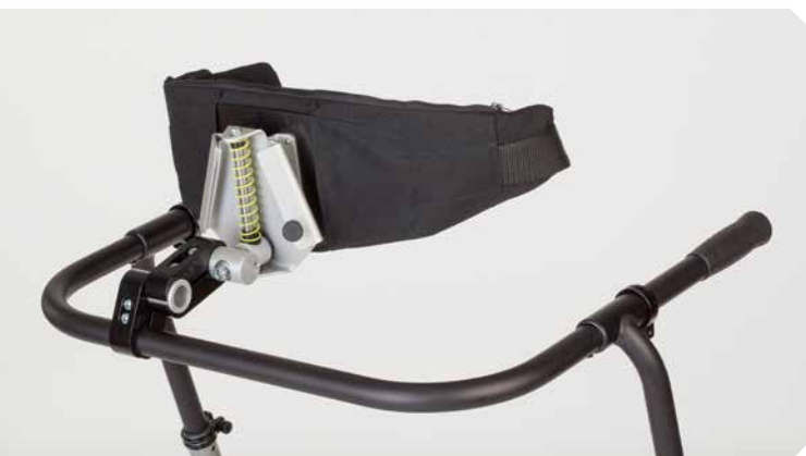
Dynamische Hüftführung mit Hüftgurt.