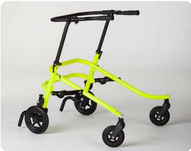
FLUX Größe 2.

FLUX ist die Laufhilfe die dich optimal fördert natürlich zu gehen. In Laufrichtung offen und befreit von physisch störenden Elementen stimuliert FLUX dich zur aufrechten Haltung während des Gehens. Die stabile und dennoch sehr leichte Konstruktion garantiert Sicherheit für deinen Bewegungsablauf.