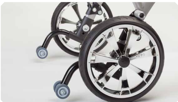
Kippsicherung mit Rollen.