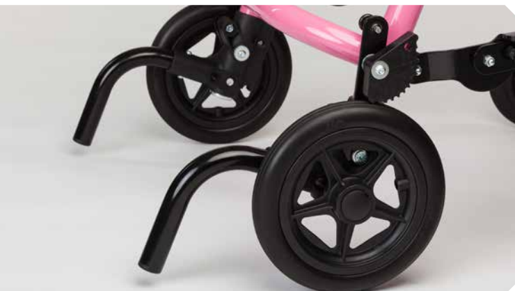
Kippsicherung ohne Rollen.