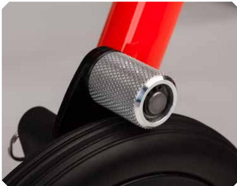
Leichtlauf-Rückrollsperrre für Größe 1-3.