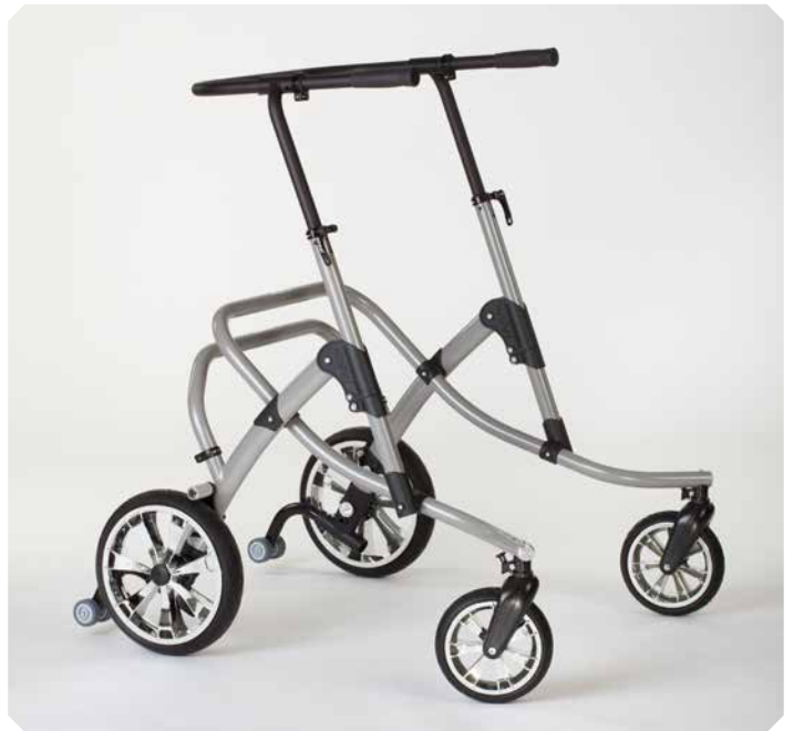
FLUX Größe 4.