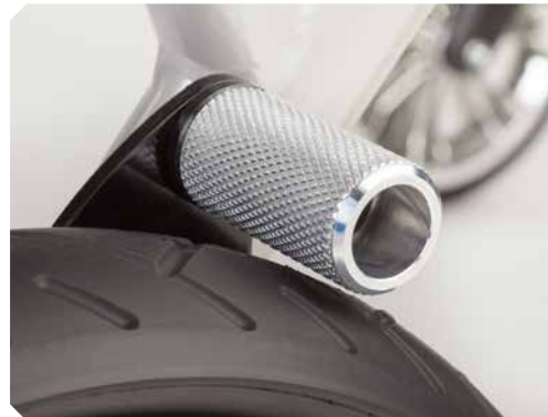
Rückrollsperrre für Größe 4.

Sicherheit durch (Leichtlauf-) Rücklaufsperrn.