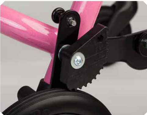
Leichtlauf-Rückrollsperrre für Größe 1+2.

Stufenlose Höhenverstellung. Sicherheit durch Rücklaufsperrn.