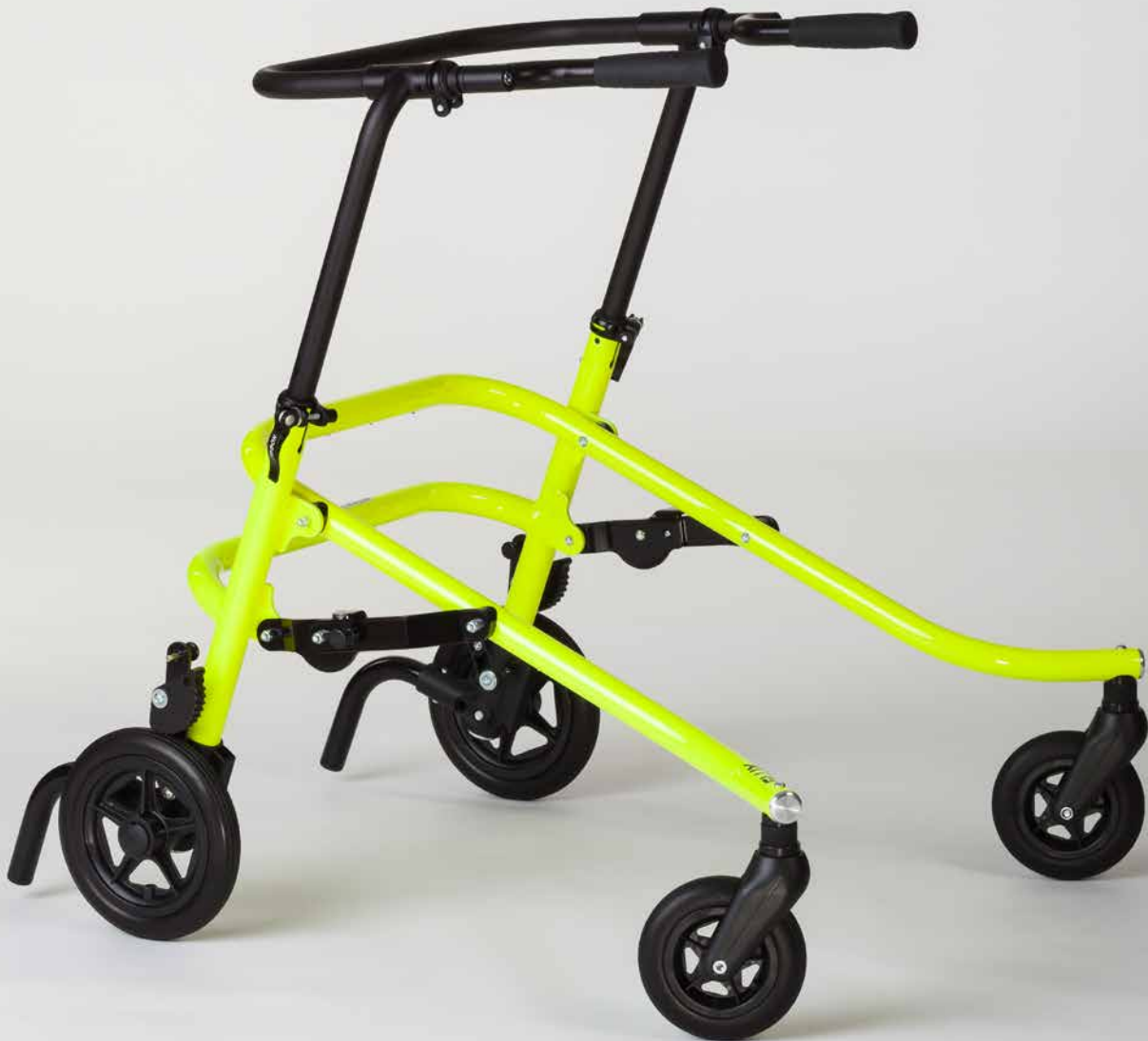
Lauflernhilfe FLUX , Größe 2

Die bewährte Lauflernhilfe im neuen Design.