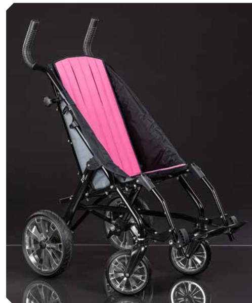
Rahmenfarbe: schwarz. Polsterfarbe: pink.