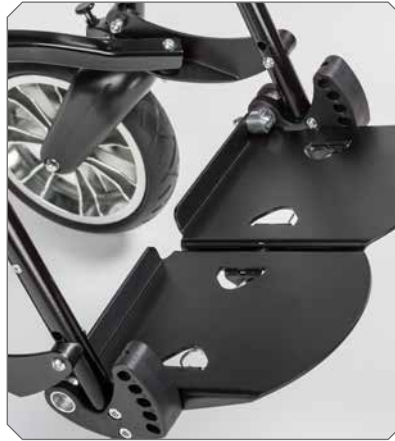
Fußbrett aus Aluminium.