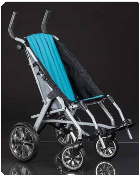
Rahmenfarbe: silber. Polsterfarbe: türkis.