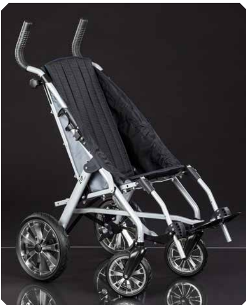
Rahmenfarbe: silber. Polsterfarbe: schwarz.